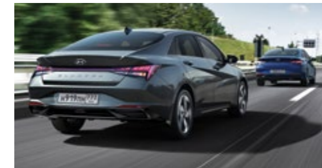
Функция обнаружения пассажира и багажа на заднем ряду (ROA)

Чтобы случайно не забыть в автомобиле важного пассажира или ценные вещи, в новой Elantra предусмотрена система предупреждения водителя.