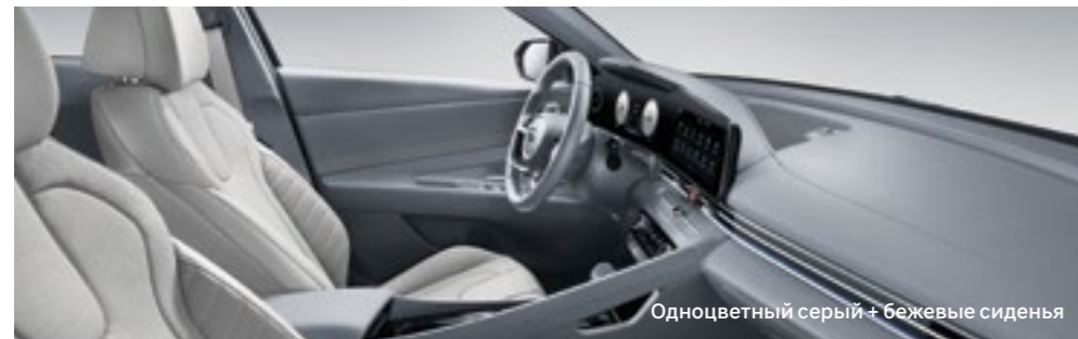
Одноцветный серый + бежевые сиденья