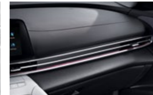
Интерьерная подсветка салона (64 цвета)