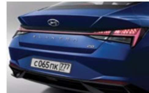
Задние светодиодные комбинированные фонари