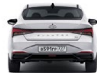
Межколёсное расстояние 1 604 (1 590) Габаритная ширина 1 825