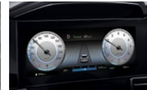
Цифровая приборная панель с диагональю 10,25"