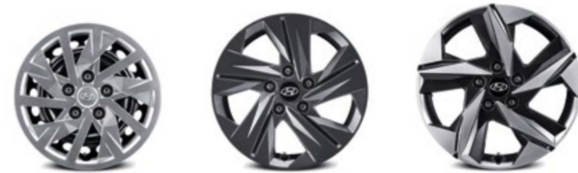
15-дюймовые стальные колёсные диски и колпаки