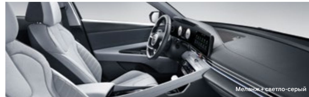
Меланж + светло-серый