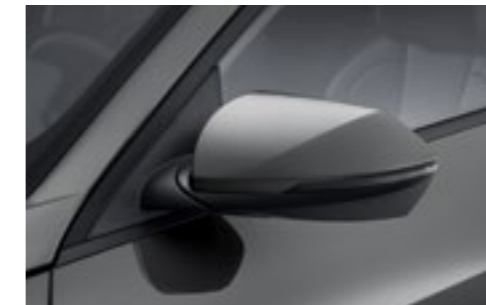
Электропривод складывания наружных зеркал