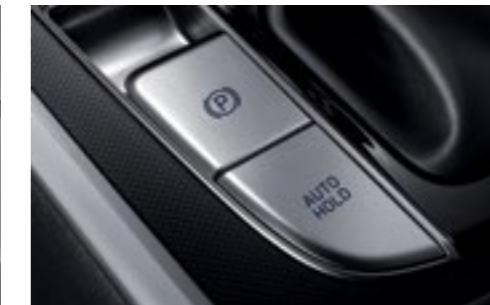
Электронный стояночный тормоз с режимом автоматического удержания (EPB)