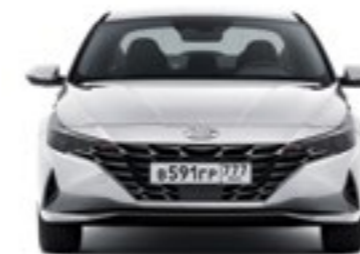
Межколёсное расстояние 1 593 (1 579) Габаритная ширина 1 825

Единицы измерения: мм, межколёсное расстояние рассчитывается исходя из диаметра дисков 15". Значение в скобках рассчитывается исходя из диаметра 17".