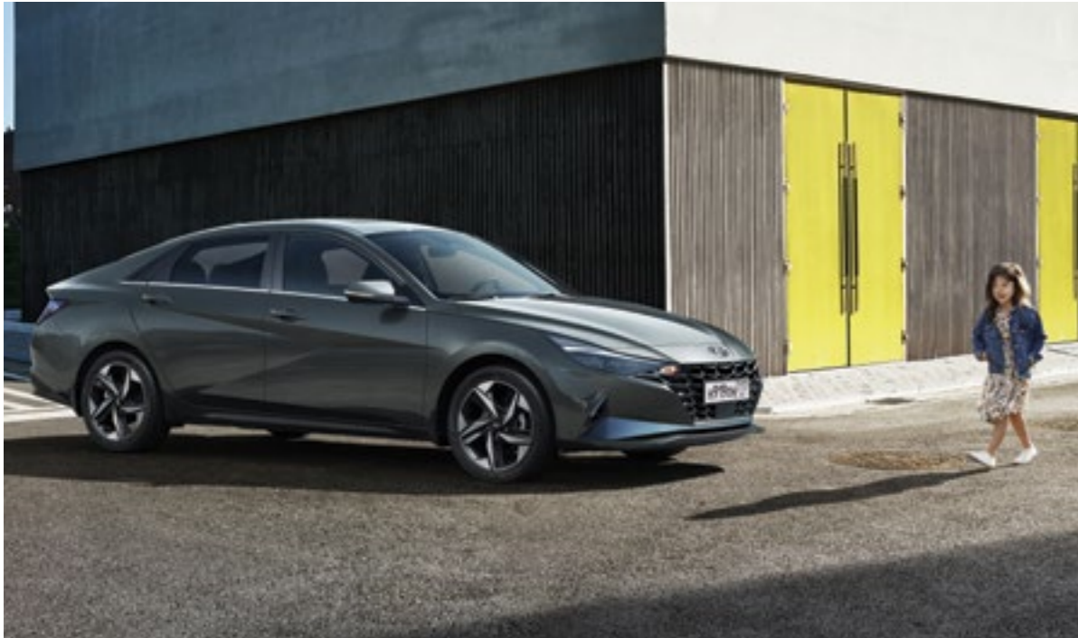
Система автоматического торможения перед препятствием спереди (FCA) с функцией контроля встречного движения при повороте налево (FCA-JT)

Система предупредит водителя об опасности в случае, если впереди идущее транспортное средство начнёт резко снижать скорость, или же существует риск столкновения с пешеходом или припаркованным автомобилем. Если уровень опасности возрастает, система автоматически активирует экстренное торможение. Экстренное торможение может быть задействовано и во время движения. Например, в ситуации, когда при левом повороте на перекрёстке возникает риск столкновения с транспортным средством, движущимся во встречном направлении.