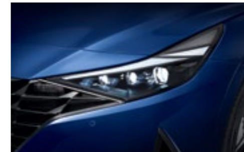
Светодиодные передние фары