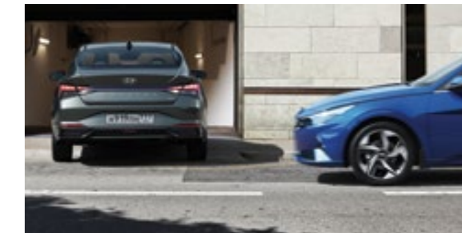
Система удержания автомобиля в центре полосы движения (LFA)

Следит за дорожной разметкой и помогает водителю удерживать автомобиль в полосе движения.