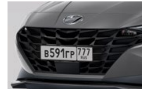
Чёрная решётка радиатора