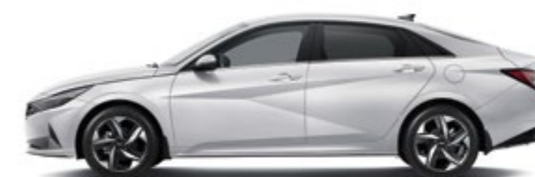
Межосевое расстояние 2 720 Габаритная длина 4 650